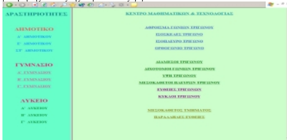
Εικόνα 2. Μαθησιακό υλικό για τη μάθηση γεωμετρικών εννοιών στην Α' Γυμνασίου

Στην Εικόνα 3 παρουσιάζεται ένα παράδειγμα δόμησης μαθησιακού υλικού για τη μάθηση της έννοιας της διαμέσου ενός τριγώνου.