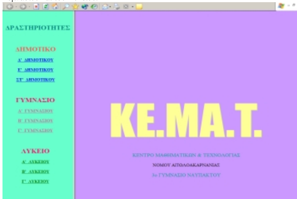
Εικόνα 1. Εισαγωγική σελίδα του ΚΕΜΑΤ για τη μάθηση γεωμετρικών εννοιών στην Α/μια και Δ/μια εκπ/ση

Το μαθησιακό υλικό είναι οργανωμένο σε ιστοσελίδες. Η αρχική ιστοσελίδα φαίνεται στην Εικόνα 1 (Εικόνα 1). Είναι οργανωμένο ανά τάξη και αφορά στην ύλη της Γεωμετρίας των τριών τελευταίων τάξεων του Δημοτικού στις τρεις τάξεις του Γυμνασίου και του Λυκείου.